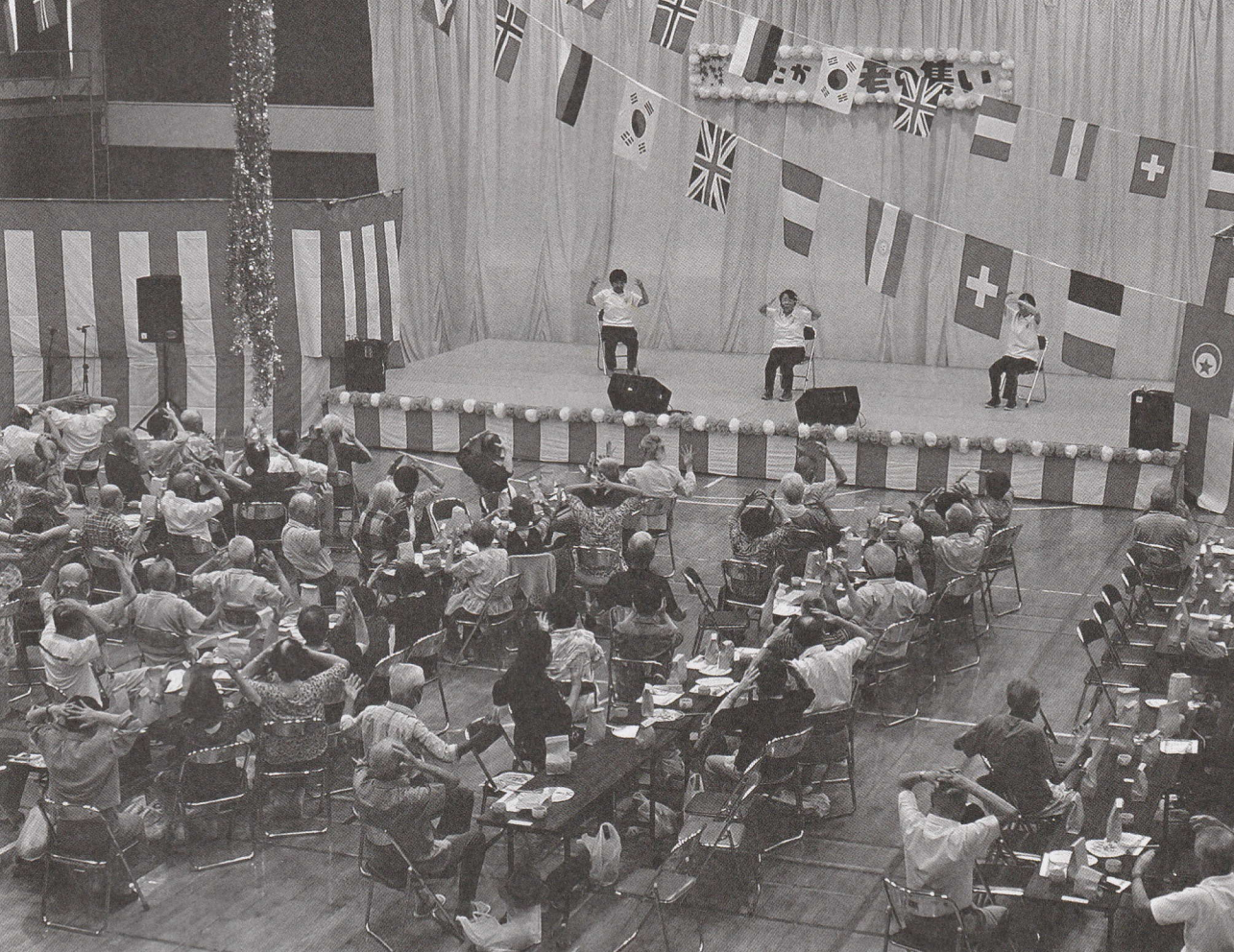
ひたか敬老の集い