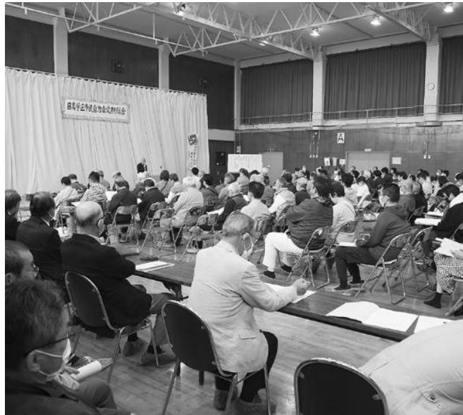
5年ぶりに来賓も招待して開催された総会