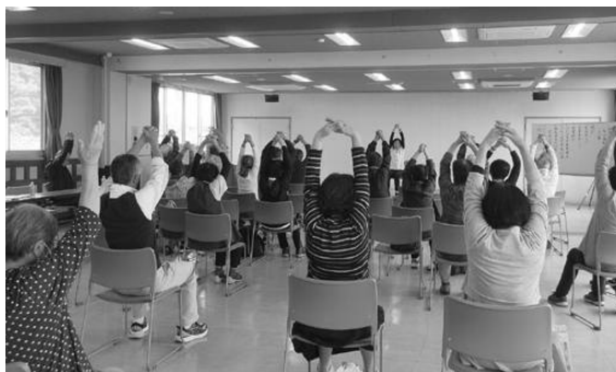
シルバーリハビリ体操を体験