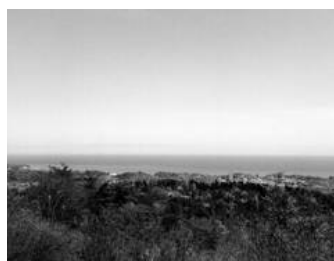
北展望台からの眺め