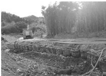
4月11日時点の工事のようす

日高学区市民自治会広報部では、茨城県が行なっている東連津川上流域の復旧工事の進捗状況について、4月11日現地を訪れて話を伺いました。担当者は「とりわけ被害の大きかった箇所約100mの長さ、高さ2mほどのブロックを5月末日までに積み上げる。それによって河川の越水がないようにしていく」と、教えてくれました。