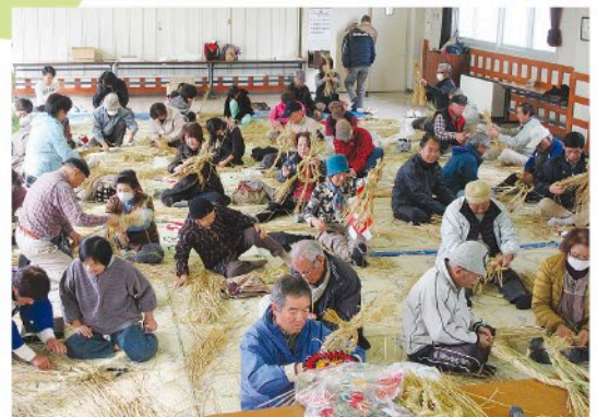
伝統行事の継承(わら細工教室)