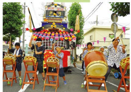
伝統芸能・行事の伝承（小木津浜風流物）

支部活動の活性化 町内会の存続と運営のバックアップ 地域に根ざした交流センターの活用促進 相談窓口の開設