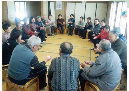
地域ふれあいサロン活動（おげんきクラブ）