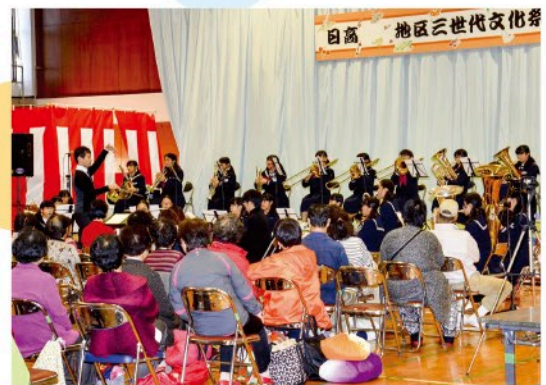
三世代文化祭の開催

文化協会との連携 （文化祭 文化講演会 各種展覧会など） 文化サークルの活動支援と紹介 伝統芸能、伝統行事の伝承 日高の文化・歴史の紹介活動 交流センター図書室の利用促進