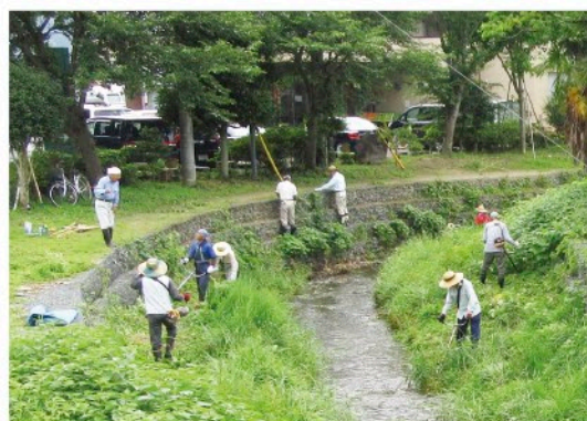
東連津川の清掃活動