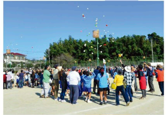
三世代スポレク祭の開催

ひたかラジオ体操への参加促進 地区別ラジオ体操の開催 健康教室、健康体操の普及促進 市民ジョギング、ウォーキング、ハイキングの実施 体育振興会との連携 (日高マラソン、各種スポーツ競技会への協賛) 食生活改善事業と健康食事づくりサポート