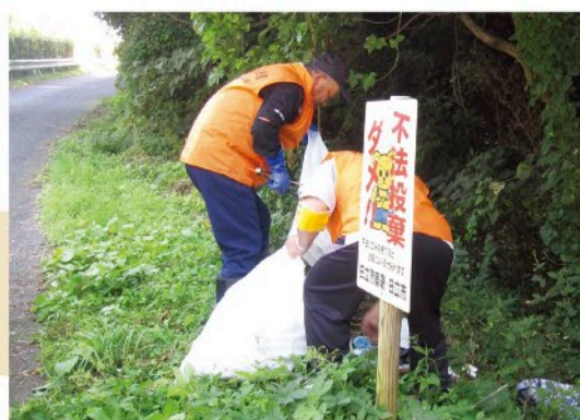
不法投棄監視活動と回収