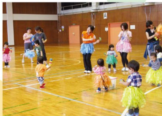
子育て支援（ゆりのき学級）

交流センターを活用した居場所づくり （子どもクラブなどの充実、夏休みチャレンジ ラジオ体操、夏休み学習室） 児童クラブとの連携 児童公園の活用とパトロール