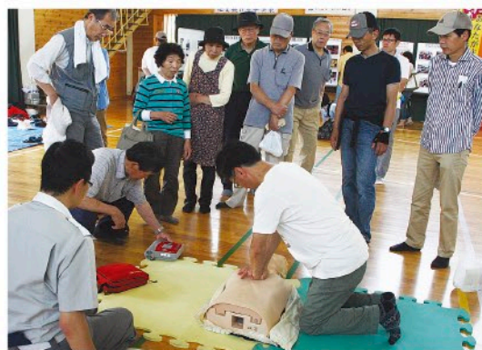
救急救命訓練の実施

自主防災会の機能と組織の充実 自然災害発生時の避難対策の整備 行政・学校と連携した総合防災訓練の実施 救急救命訓練の実施 災害時要援護者の避難援助体制づくり