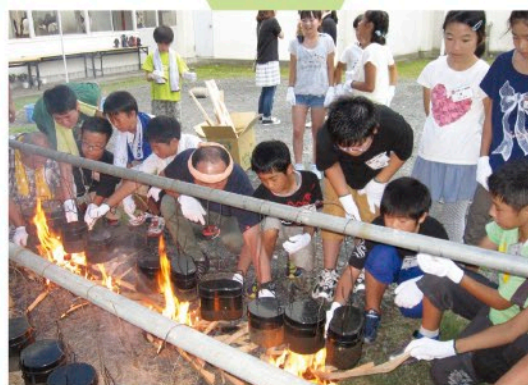
日高っ子体験村の充実

自治会主催行事への実行委員としての参画 （日高おんもさ祭り、日高学区三世代スポレク祭、 日高ふれあい鳥追い祭り、敬老会など） 日高っ子体験村の充実 子ども講座（地域人材の活用） 学校との連携（総合学習支援）