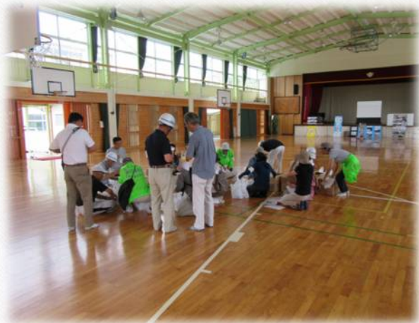
支援物資の仕分け (飲料水・備蓄米)

日立市避難行動要支援者名簿登載の方を対象に、支部福祉協力員が安否確認と支援物資配付訓練を行います