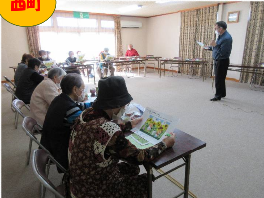
西町おげんきクラブ「脳トレ」