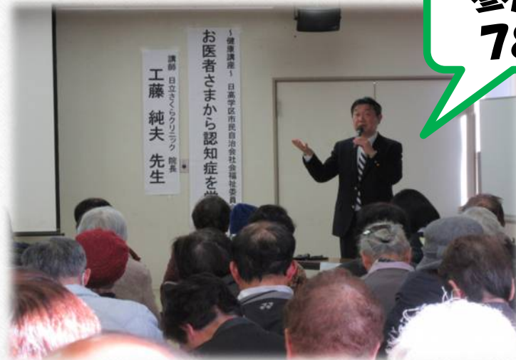
お医者さまから認知症を学ぼう