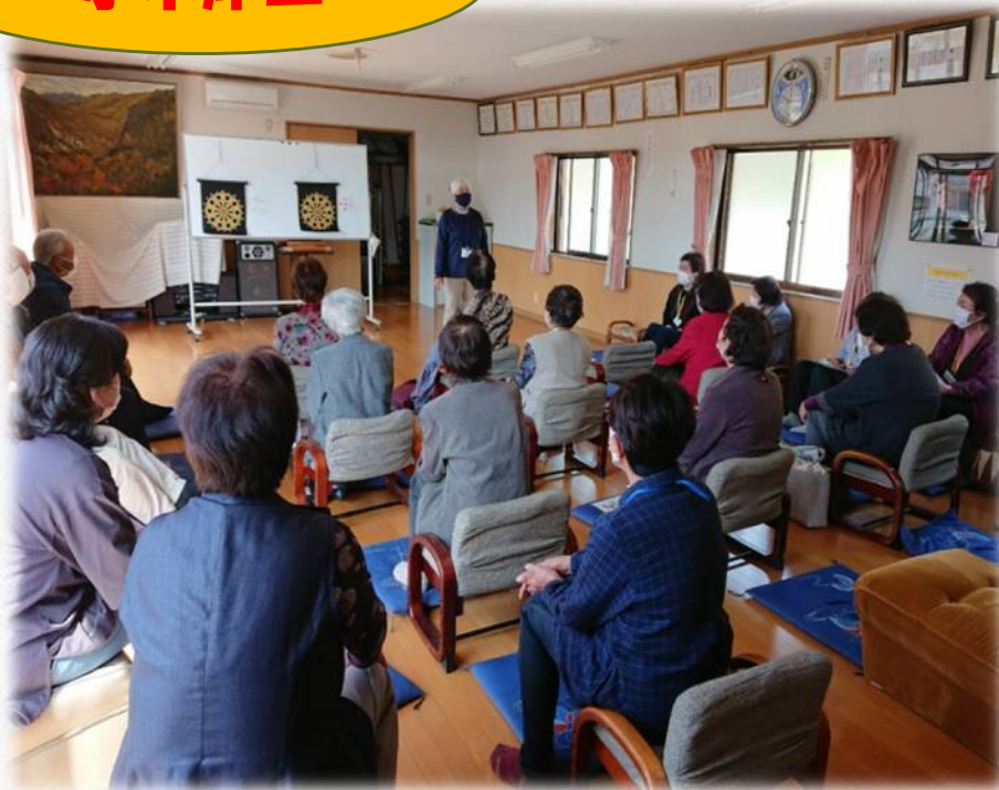
ロイヤルサロン小木津山 「ダーツゲーム」