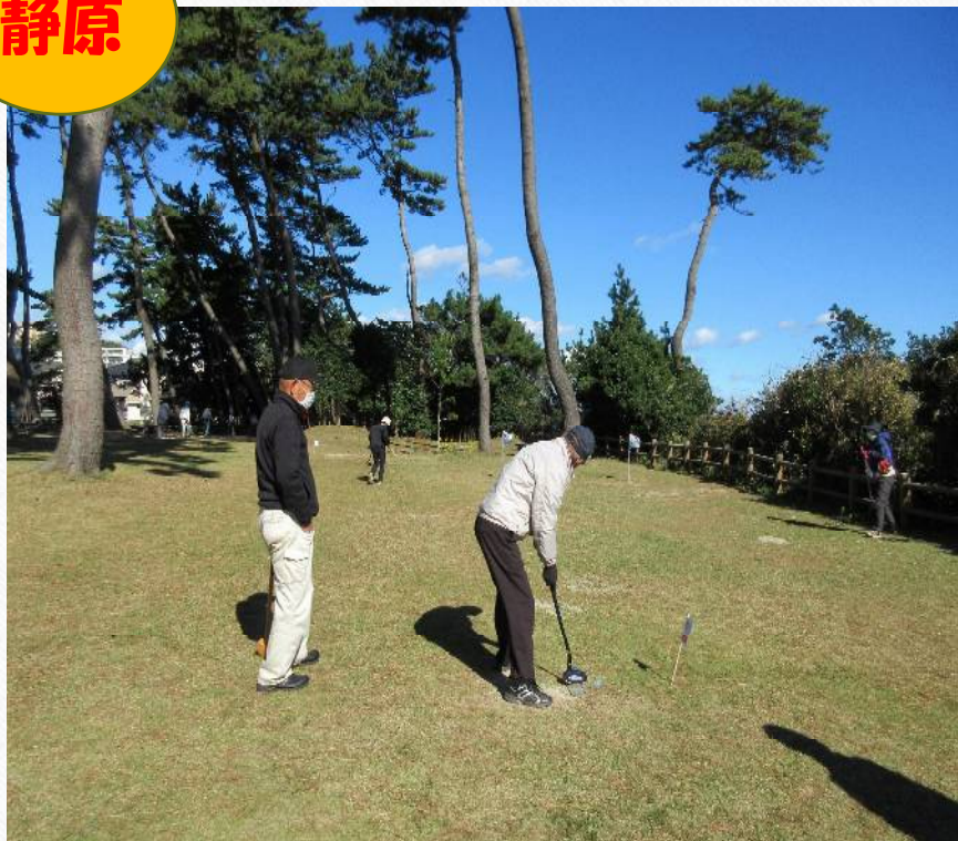
静原おげんきクラブ 「グランドゴルフ」