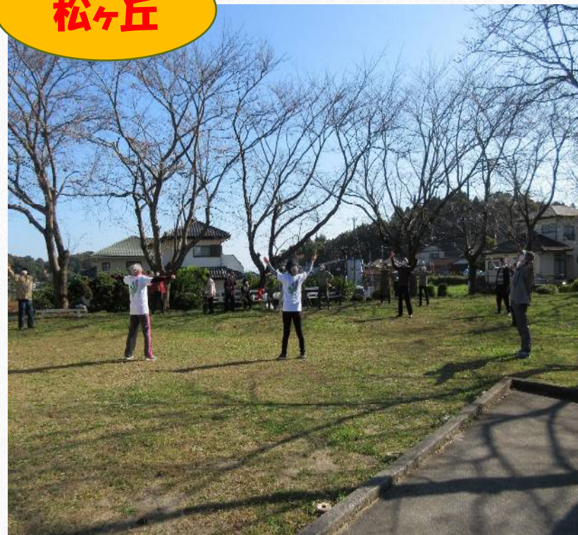
松ヶ丘ふれあいサロン 「ラジオ体操」