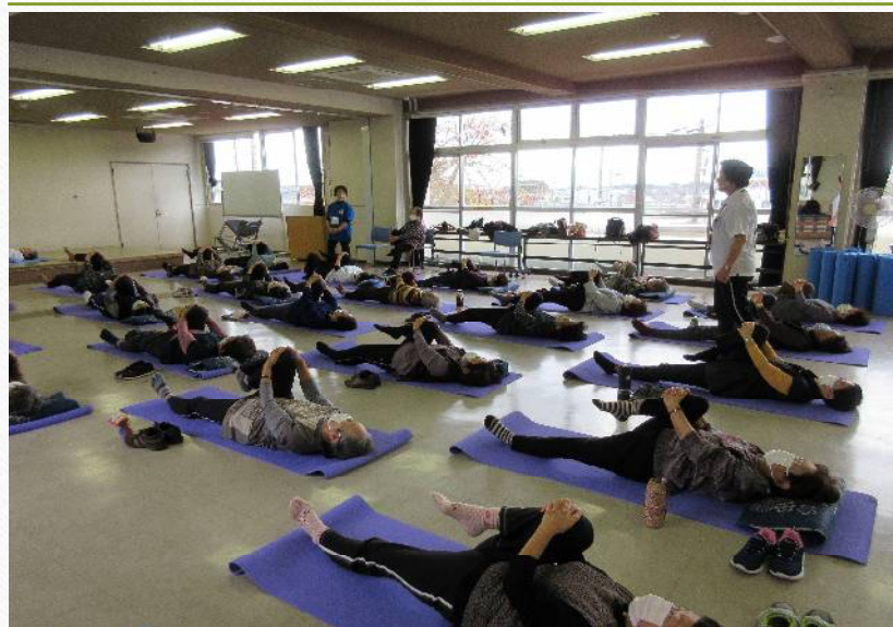
女性教室 寝てする体操