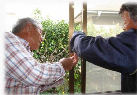
トンカチの会点検作業