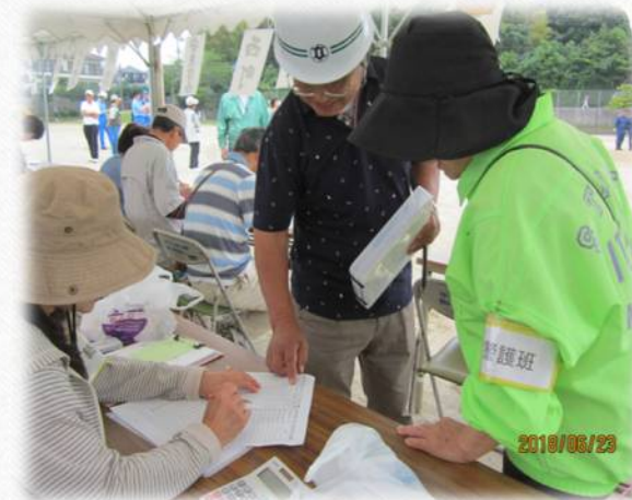
要支援者の 状況調査報告