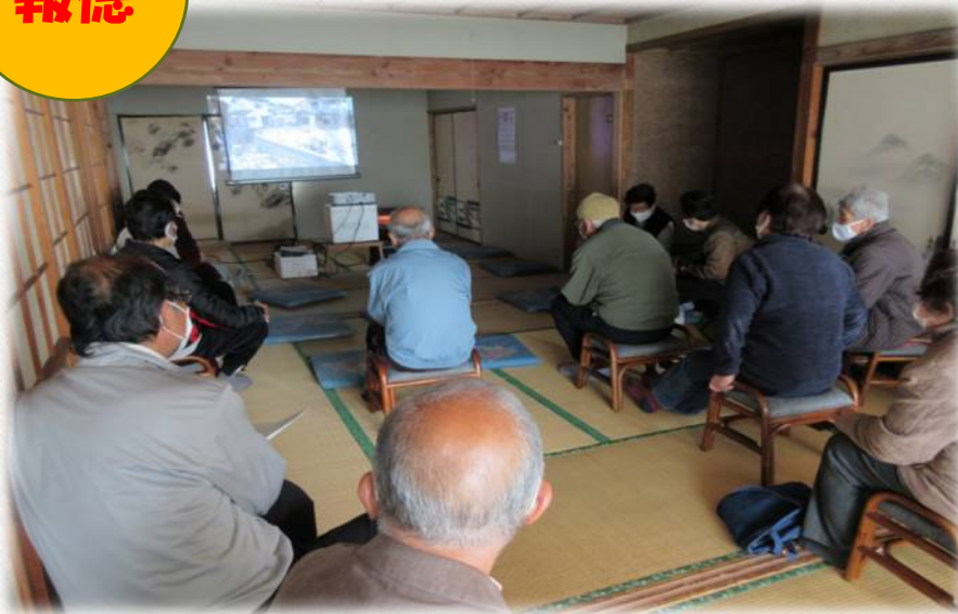
報徳おげんきクラブ「ビデオ鑑賞」