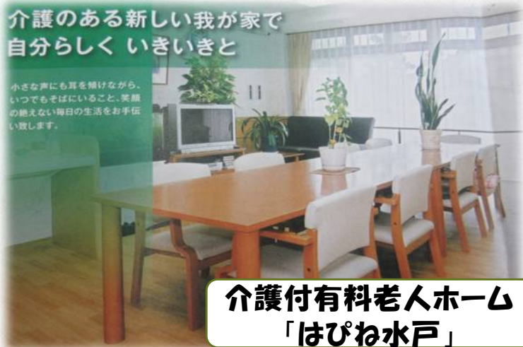
介護付有料老人ホーム 「はぴね水戸」

小さな声にも耳を傾けながら、 いつでもそばにいること、笑顔 の絶えない毎日の生活をお手伝 い致します。