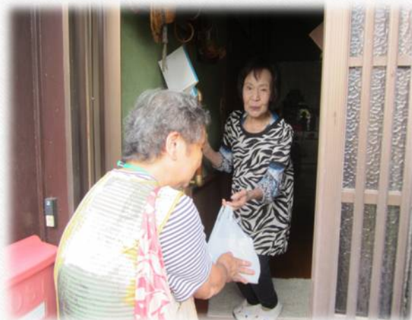
協力員による安否確認