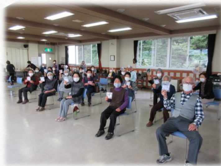
スマイルワンよりマスクを いただきました