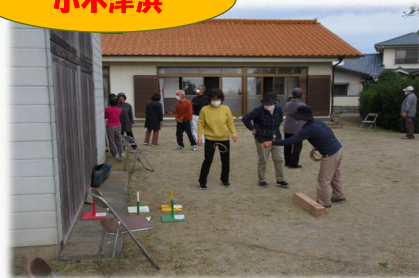
小木津浜おげんきクラブ「屋外スポーツ」