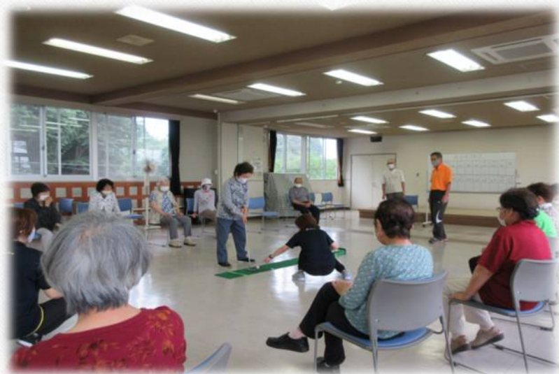
ルーレットゴルフ