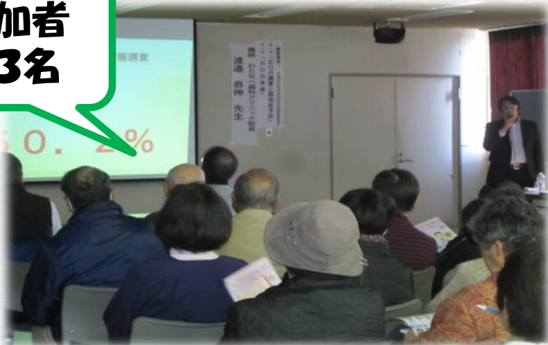
お口の健康と認知症予防