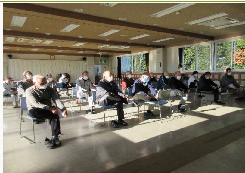
男性教室 椅子での体操