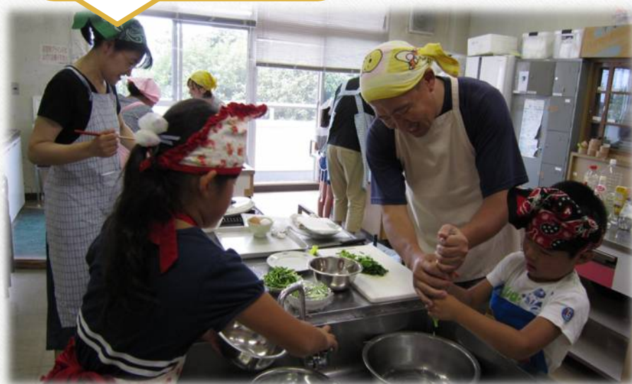
親子クッキング教室