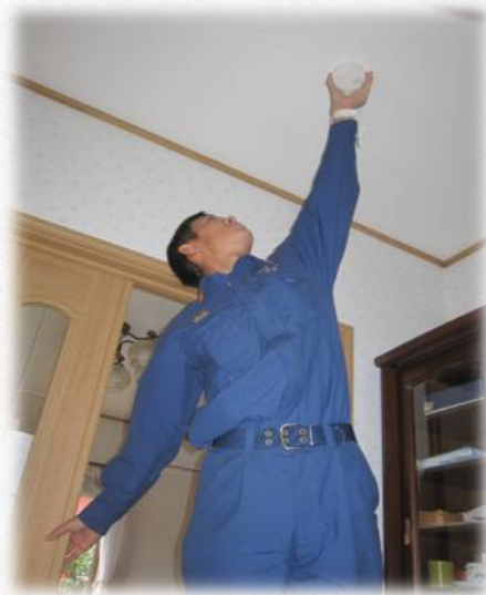
火災報知器の点検