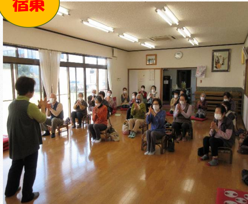
宿東おげんきクラブ 「シルバーリハビリ体操」