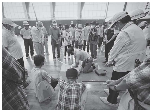
防災訓練・AED使用訓練