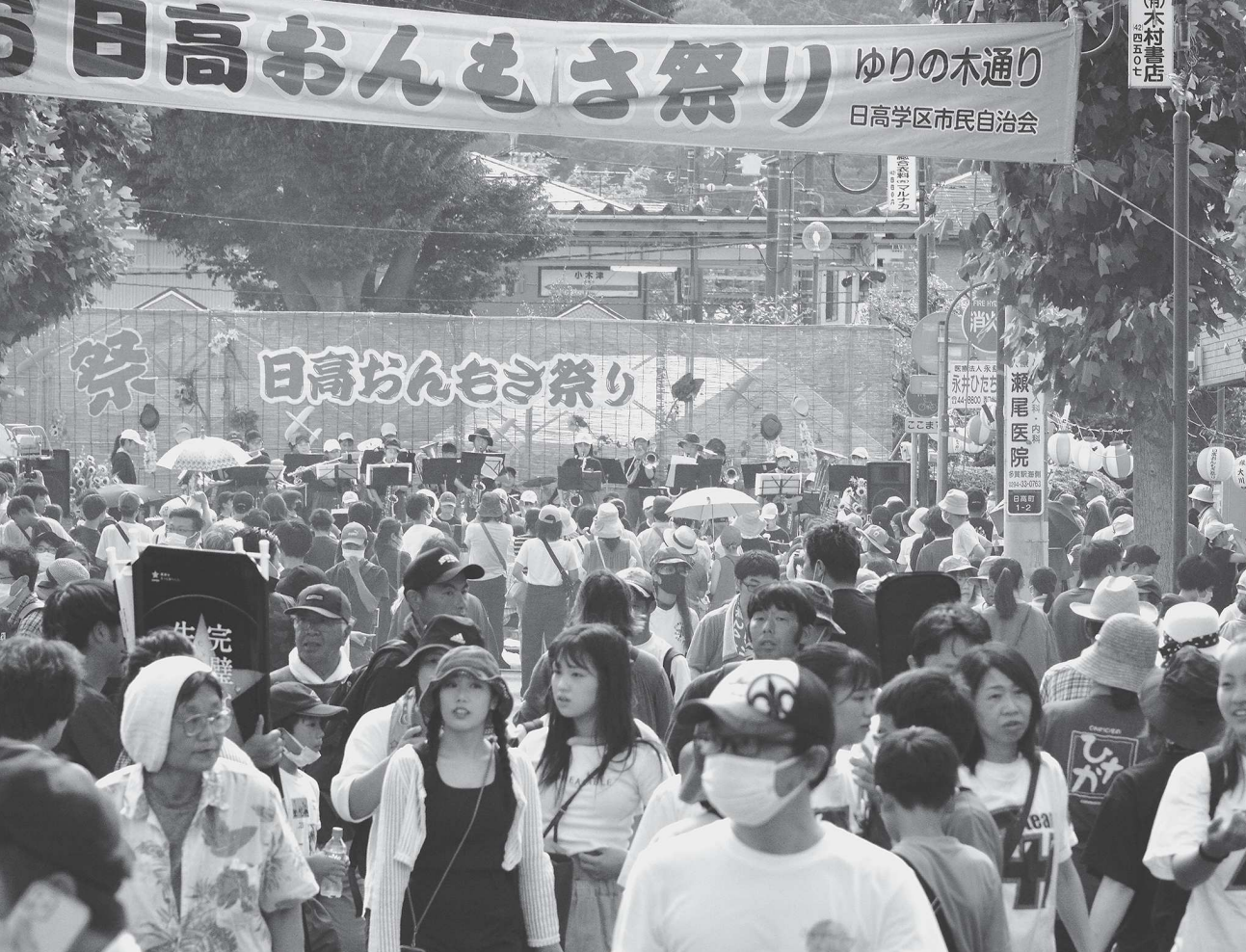
帰ってきた「おんもさ祭り」の賑わい