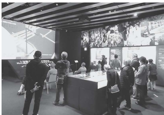
福島にて原発事故の研修