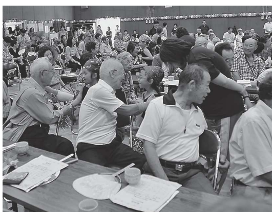
以前のような敬老事業を