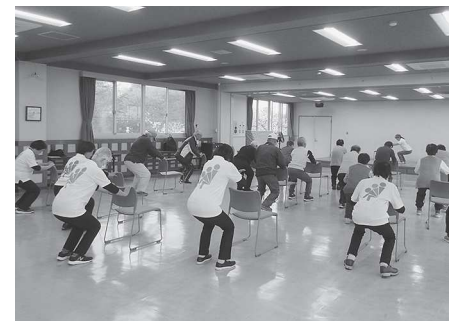
シルバーリハビリ体操