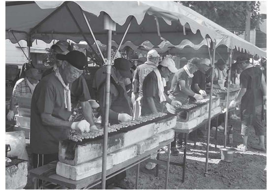
おんもさ祭り名物焼き鳥