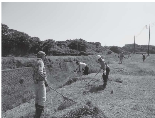
東連津川をきれいにする会