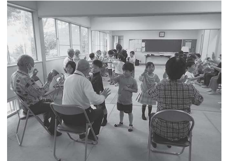
ふれあいサロン静原