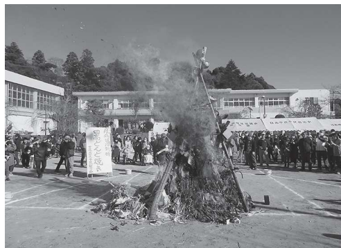
鳥追い祭り・どんど焼き