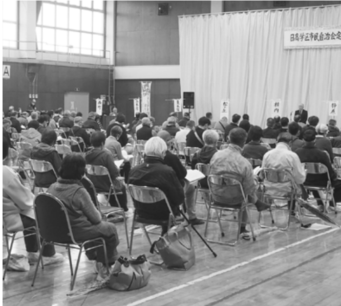
年間の活動計画を審議する自治会役員の方皆さん