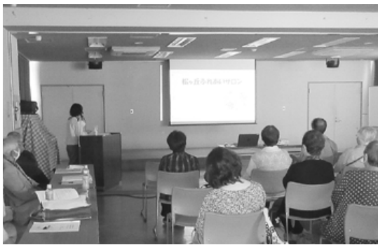
福祉活動の様子を確認しました

4月20日、日高交流センター2階1号室において、日高学区市民自治会社会福祉委員会との連絡会が開かれました。おもちゃライブラリーなどの子育て支援事業、にこにこクラブ・ふれあいサロン・見守り支援などの高齢者等支援事業、おんもさ祭り・敬老会・鳥追い祭りなどのイベント支援事業を支えるボランティアの方36名が参加しました。