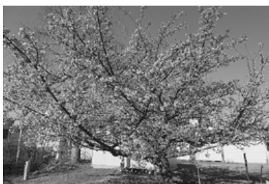
シンボルの日立紅寒桜

日高交流センター前広場にあり、自由に見花が出来ます。今年の春も自治会員有志の皆さんの手でほんぼりが飾られ、昼間のみならず、夜桜を綺麗に映し出していました。